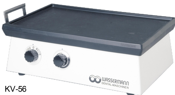
KV-56 Alu-Gussgehäuse kunststoffpulverbeschichtet (naturweiß ähnlich RAL 9016)